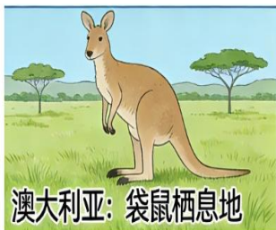
澳大利亚：袋鼠栖息地